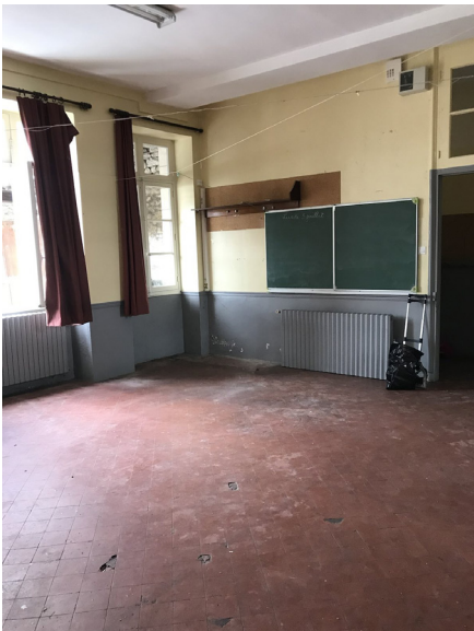
▲ La classe de CE1-CE2, avant