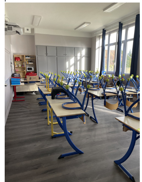
▲ La classe de CMI-CM2, après

Notre priorité est de conserver nos écoles dans nos villages, tant à Loconville, où l'environnement est particulièrement adapté aux maternelles, qu'à Liancourt Saint-Pierre avec le périscolaire. Nous devons améliorer la circulation et le stationnement du bus et des véhicules des parents. Ces sujets sont au cœur de la sécurité des enfants et des parents au moment de la sortie