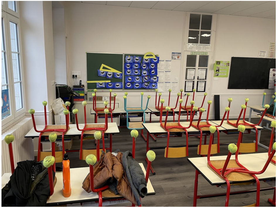
▲ La classe de CE1-CE2, après : neuve du sol au plafond, murs compris

E t puisqu'il était en place, nous en avons profité pour rénover également la classe des CMI - CM2. Désormais, tout est beau, tout est propre, les élèves sont dans des classes rinnovées, mieux équipées et bien plus accueillantes. Pendant ces travaux, les enfants étaient dans la même cour d'école, sans avoir besoin de traverser la route aux récréations. Cela permettait aux enseignantes de mieux échanger, de passer d'une classe à l'autre plus facilement... les prémices d'une école aux classes réunies du même côté de la rue.